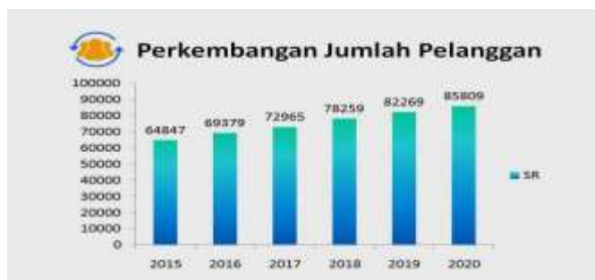
Gambar 1.1

Fenomena yang ada khususnya di kota Jambi pembayaran tarif terhadap perusahaan daerah air minum (PDAM) mengalami kenaikan di mana pada bulan Oktober-Desember tahun 2018 mengalami kenaikan dari Rp 2.000/m 3 menjadi Rp 3.600/m 3 , dan pada bulan Januari 2019 kenaikan tarif kembali mengalami peningkatan hingga Rp 4.000/m 3 sehingga cukup meresahkan sebagian masyarakat.