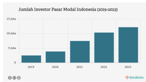
Gambar 1.2 Jumlah Investor Pasar Modal Indonesia (2019-2023)

Berdasarkan data yang berasal dari Sensus Penduduk Badan Pusat Statistik disajikan oleh Goodstats pada tahun 2020, komposisi penduduk Indonesia Berdasarkan Umur didominasi oleh Gen Z dengan presentase sebesar 27,94% populasi di Indonesia atau sekitar 74,93 juta jiwa.