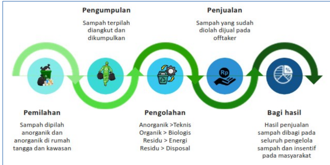
Gambar 4.2: Design Kebijakan Social Engineering dan Alur Strategi

kelembagaan lokal yang mampu mengelola aktivitas ekonomi dari sampah. Dengan memadukan pendekatan sosial, ekonomi, dan kelembagaan, program Broh Jeut Keu Peng diharapkan mampu mendorong perubahan paradigma masyarakat dalam memandang dan mengelola sampah.