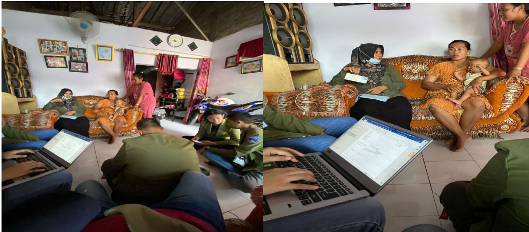
Gambar 3.3 Pendataan SJPH dan pembuatan NIB di UMKM jamu Mak Diah.

Ketenagakerjaan, dan BPJS Kesehatan. Setelah sudah masuk , pada layar perangkat yang digunakan nantinya akan muncul pengaturan kata sandi (password) akun OSS. Di tahap ini, para pelaku UMKM dapat mengatur sendiri kata sandi yang diinginkan sesuai dengan kombinasi yang mudah diingat tetapi memiliki kekuatan yang cukup yaitu berupa 8 karakter dengan huruf kapital, huruf kecil, angka dan karakter spesial. Lalu, hak akses sudah bisa dipergunakan untuk masuk ke sistem OSS dan melanjutkan pengisian Formulir Data Pelaku Usaha.