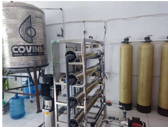
Gambar usaha depot air minum ponpes darul ulum al – hidayah

Untuk saat ini jangkauan pasar UD. Barokah masih meliputi sekitaran Tondo saja, kedepannya kami berencana untuk menguasai Pasar Kota Palu. Kemudian dengan adanya program MBKM memberikan inovasi kepada saya untuk membuat usaha baru yang cukup menjanjikan yaitu usaha air galon, usaha air galon dimulai pada tanggal 23 oktober yang dimana kami memulai dengan memasang perlengkapan air galon RO dan melakukan promosi, dari rumah ke rumah, warung ke warung, dan kantin kampus universitas tadulako.