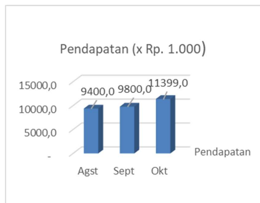
Gambar Grafik Omset Penjualan UD Barokah