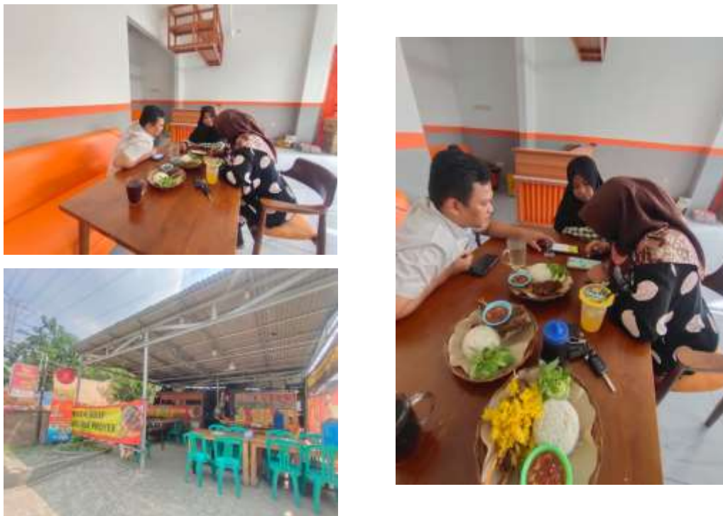
Gambar 2. Diskusi dan Pengaplikasian Platform Digital

Diskusi dengan peserta juga dilakukan untuk mengetahui sejauh mana peserta dapat menerima dan menyerap materi yang diberikan, serta dapat melihat kesulitan-kesulitan seperti apa yang dihadapi peserta pada saat proses kegiatan.