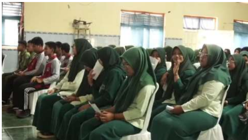
Gambar 1. Peserta Sosialisasi Pemilu 2024