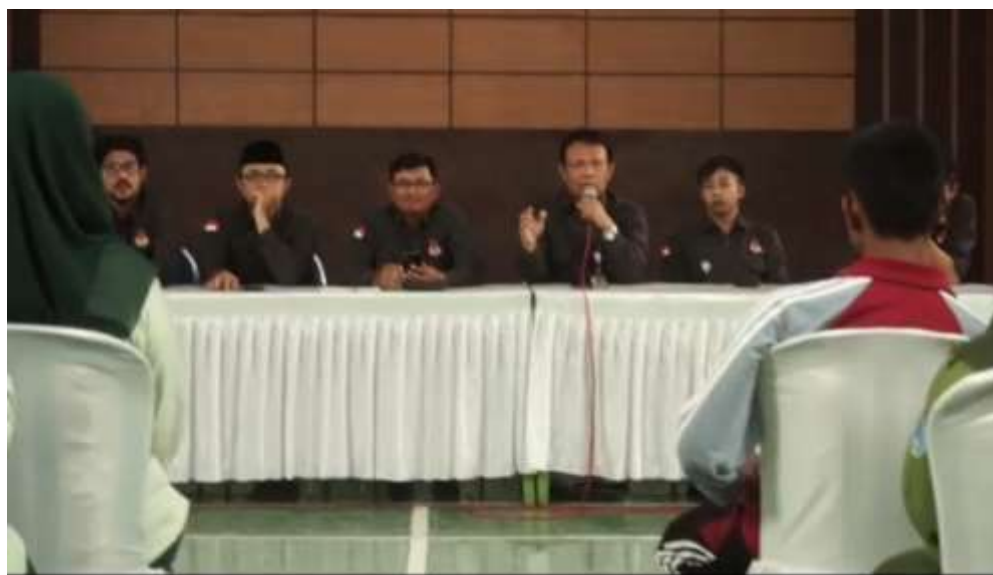
Gambar 2. Pemaparan Materi Sosialisasi Pemilu 2024

Kegiatan sosialisasi ini yang dilaksanakan pada tanggal 23 November 2023 dimulai jam 08.00 sampai 11.00 wib di Gedung pemuda kecamatan Nglegok merupakan sosialisasi pemilu bagi pemilih pemula di pemilu 2024. Kegiatan ini dilaksanakan dengan cara presentasi dan diskusi tentang pemilu, cek DPT online serta partisipasi pemilih pemula.