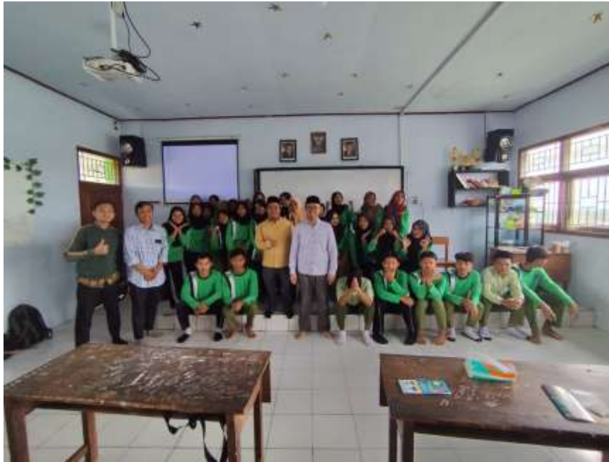
Gambar 2. Foto Bersama selesai Bimbingan

Bimbingan ini diadakan pada tanggal 12 Desember 2024 dimulai jam 08.00 sampai 11.00 wib di aula MA Ma'arif Ponggok. Program bimbingan dilaksanakan dengan menggunakan cara diskusi serta presentasi tentang perguruan tinggi, Fakultas, Program Studi serta biaya kuliah. melakukan koordinasi dengan Madrasah Aliyah Ma'arif Ponggok serta survei menjadi tahapan yang pertama tentang peserta bimbingan, diketahui ada 30 siswa kelas XII MA Ma'arif Ponggok. Yang ke kedua, melaksanakan bimbingan dengan metode workshop. Tim memberikan pertanyaan-pertanyaan pre-tes kepada para peserta sebelum penyampaian materi, seperti: 1). Apa yang kamu ketahui tentang Perguruan Tinggi, 2). Apakah kamu tahu tentang Fakultas, 3). Apakah kamu tahu tentang Program Studi, 4). Apakah kamu ingin melanjutkan ke perguruan tinggi 5). Program Studi apa yang kamu inginkan, 6) Kamu setelah lulus MA langsung kerja atau melanjutkan kuliah.