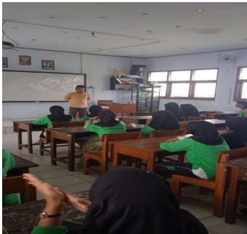
Gambar 1. Memberikan Sosialisasi tentang perguruan tinggi

Pengabdian masyarakat ini, menggunakan layanan informasi yang berupa layanan bimbingan orientasi pasca Ujian Akhir Sekolah kepada siswa dan siswi di MA Ma'arif Ponggok yaitu dengan sosialisasi, pemberian motivasi dan pengenalan dunia kampus supaya siswa MA Ma'arif Ponggok memiliki tekad untuk lanjut ke perguruan tinggi, Di samping itu, dengan disediakan layanan informasi ini, diyakini para siswa akan terpacu untuk melanjutkan studi di perguruan tinggi guna memilih bidang kejuruan yang sesuai dengan minat dan kemampuannya.