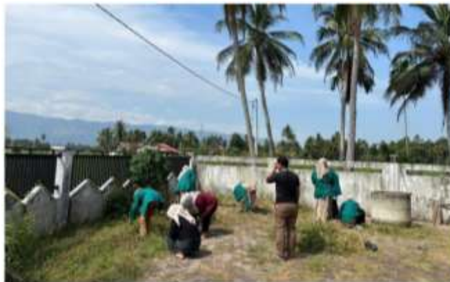
Gambar 1 Gotong Royong di Kantor Desa

Desa Lampreh Lamjampok telah terlaksana dengan baik dan memberikan dampak positif bagi masyarakat setempat. Berbagai program yang telah dilakukan, seperti penyuluhan kesehatan, edukasi literasi, pelatihan keterampilan, hingga kegiatan gotong royong, berhasil meningkatkan kesadaran warga terhadap berbagai isu penting, seperti kebersihan lingkungan, kesehatan, dan pemanfaatan sumber daya lokal. Antusiasme masyarakat dalam mengikuti beberapa kegiatan juga menunjukkan adanya keinginan untuk berubah dan memperbaiki kualitas hidup mereka. Kegiatan ini juga menjadi wadah bagi masyarakat untuk bersosialisasi, memperkuat hubungan antarwarga, dan menumbuhkan semangat kebersamaan. Selain itu, efek positif dari gotong royong dirasakan oleh peserta, dengan kegiatan gotong royong dapat memberantaskan nyamuk penyebab demam berdarah di lingkungan perkarang tempat tinggal warga hal ini sejalan dengan tema KKN yang dilaksanakan pada kegiatan ini yang menunjukkan bahwa gotong royong dapat meningkatkan kualitas hidup dan menurunkan risiko penyebaran nyamuk demam berdarah.