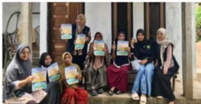
Gambar 2 Pembagian Brosur Pencegahan DBD dilingkungan warga desa