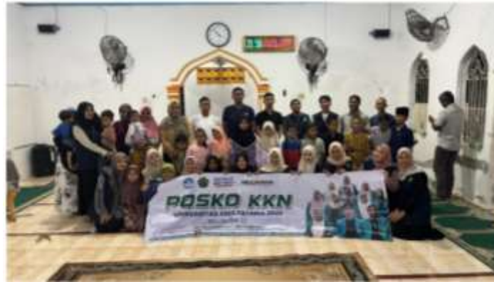
Gambar 3 penyuluhan tentang DBD dan pembagian spray anti nyamuk