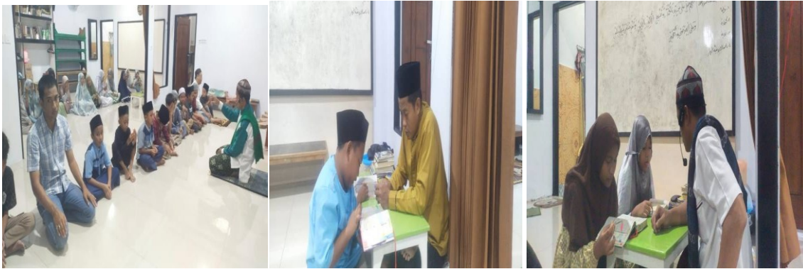
Gambar 1. Kegiatan Pendampingan Metode Talaqqi, Imla', dan Muroja'ah

Berdasarkan hasil penilaian akhir, terjadi peningkatan kemampuan baca tulis, hafalan, kualitas tajwid, serta kefasihan bacaan santri yang mencakup ketepatan makharijul huruf dan sifatul huruf. Pada aspek kelancaran baca tulis dan hafalan, berdasarkan skala penilaian 1–5 (1 = sangat kurang, 5 = sangat baik), capaian santri berada pada rentang nilai 3–5. Lima santri memperoleh nilai 5 (sangat lancar), empat santri memperoleh nilai 4 (cukup lancar), dan enam santri berada pada nilai 3 (perlu perbaikan). Pada aspek kualitas tajwid, empat santri mencapai nilai sempurna 5, enam santri memperoleh nilai 4, dan lima santri memperoleh nilai 3. Sementara itu, pada aspek kefasihan (fashahah) bacaan, sembilan santri mencapai nilai 5, tiga santri memperoleh nilai 4, dan tiga santri berada pada nilai 3. Data ini menunjukkan bahwa sebagian besar santri telah mengalami peningkatan yang cukup baik dalam aspek ketepatan bacaan Al-Qur'an setelah mengikuti pendampingan.