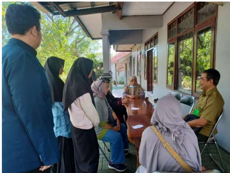
Gambar 3. Koordinasi pelaksanaan kegiatan dengan pihak TN Baluran

Program pengabdian masyarakat berupa pelatihan pembuatan kerupuk ikan yang melibatkan ibu-ibu PKK desa sumberwaru mendapatkan perhatian penuh dari ibu-ibu PKK sekaligus masyarakat desa Sumberwaru secara umum. Program yang diawali dengan survei kondisi lapangan, meminta izin kepada pihak Taman Nasional Baluran (Gambar 3), dan pelaksanaan penyuluhan ini berhasil memberikan edukasi kepada ibu-ibu PKK dalam pengolahan kerupuk ikan.