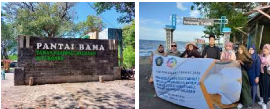
Gambar 1. Pantai yang berbatasan langsung dengan TN Baluran. (a) Pantai Bama dan (b) Pantai Ketapang Indah

Program penyuluhan yang berorientasi pada pemberdayaan ibu-ibu PKK dapat memberikan edukasi kepada masyarakat agar dapat memahami dan mengoptimalkan potensi yang mereka miliki untuk mencapai tujuan pemberdayaan, yaitu kesejahteraan hidup masyarakat. Pengolahan ikan menjadi kerupuk sebagai salahsatu peningkatan ekonomi memiliki potensi untuk dikembangkan karena pembuatan kerupuk membutuhkan bahan murah dan mudah didapat. Kerupuk merupakan salah satu jenis makanan kering yang terbuat dari bahan-bahan yang mengandung pati cukup tinggi dan merupakan jenis makanan kecil yang mengalami pengembangan volume dan mempunyai densitas rendah selama proses penggorengan.