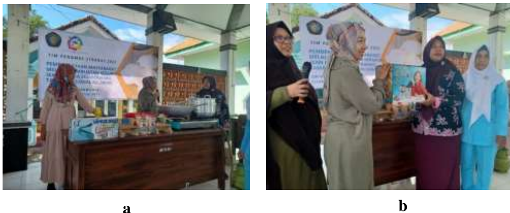
Gambar 5. (a) Bantuan modal berupa peralatan untuk operasional pembuatan krupuk ikan (b) serah terima bantuan peralatan dari Tim Pengabdian Strategis UB ke Tim Penggerak PKK Desa Sumberwaru, Kecamatan Banyuputih, Kabupaten Situbondo.