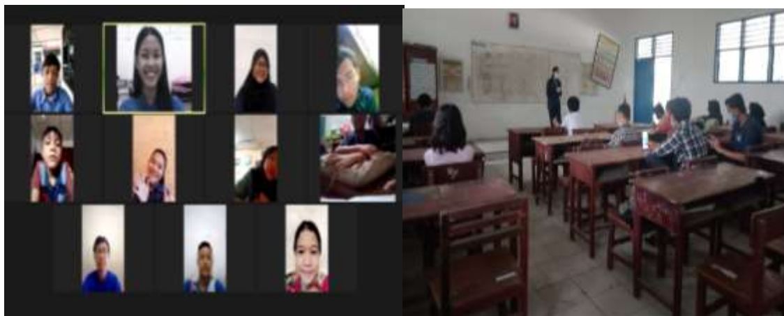
(a) (b) Gambar 1. (a) Pembelajaran Daring (b) Pembelajaran Luring

siswa menjadi salah satu stimulus yang cukup penting untuk menumbuhkan rasa ingin tau siswa, hal ini dikarenakan bertanya merupakan proses awal dalam berpikir. Kegiatan bertanya selama proses belajar mengajar berlangsung baik secara daring maupun luring, baik disekolah maupun dirumah.