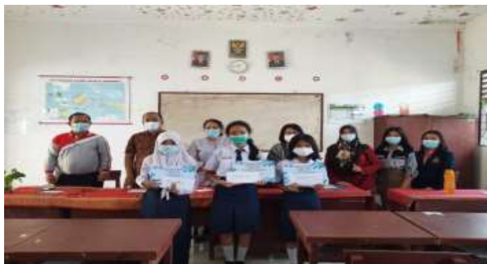
Gambar.3 Pemberian Hadiah Kepada Siswa Pemenang Lomba Story Telling

Pada kegiatan ini, Peserta Program English Day membantu pembuatan nilai ujian siswa dalam bentuk excell lalu meporkannya kepada setiap waki kelas. Selain itu mahasiswa juga dilibatkan dalam membantu pembuatan surat menyurat di bagian Tata Usaha serta membantu membagikan buku materi pembelajaran kepada semua siswa. Mahasiswa juga wajib menyediakan perangkat pembelajaran berupa rencana pelaksanaan pembelajaran (RPP), bahan ajar, media pembelajaran, lembar kerja peserta didik (LKPD), instrumen evaluasi/penilaian, serta bahan evaluasi setiap tema pembelajaran.