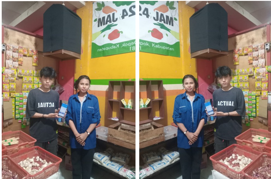
Gambar 3 Bik Kom Kos Sayur & Sembako 24 Jam