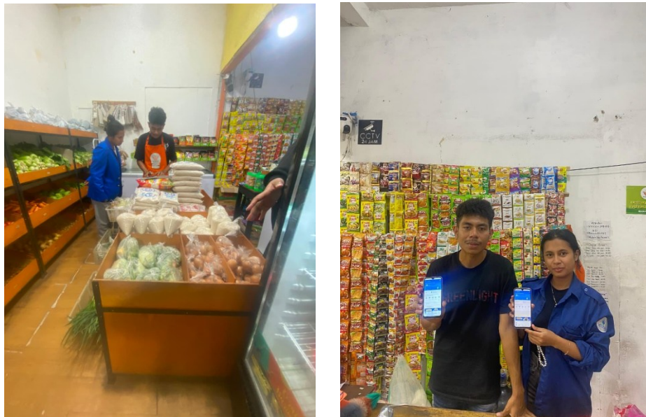
Gambar 2. Kedai Sesay 24 Jam