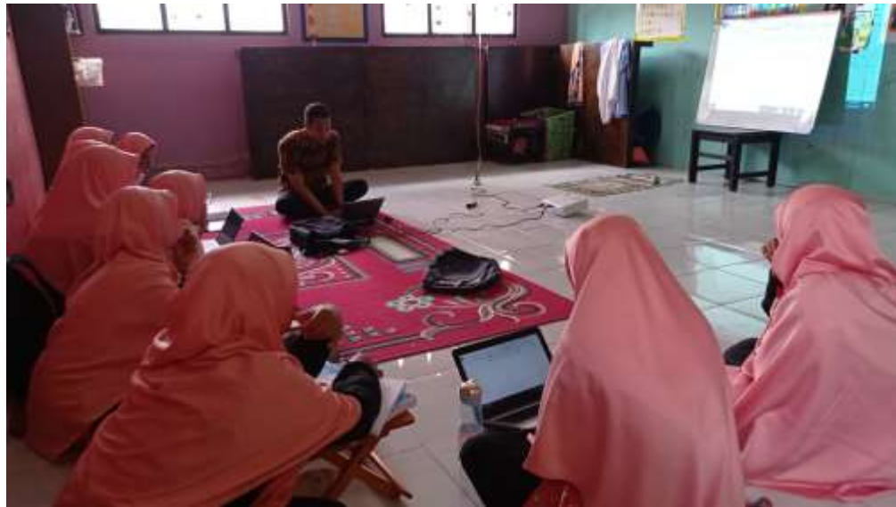
Gambar 1. Pelatihan penggunaan microsoft word.