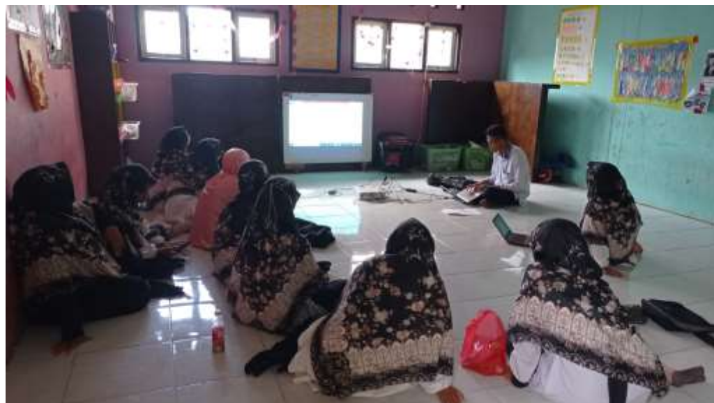
Gambar 2. Penyampaian materi tentang microsoft word.