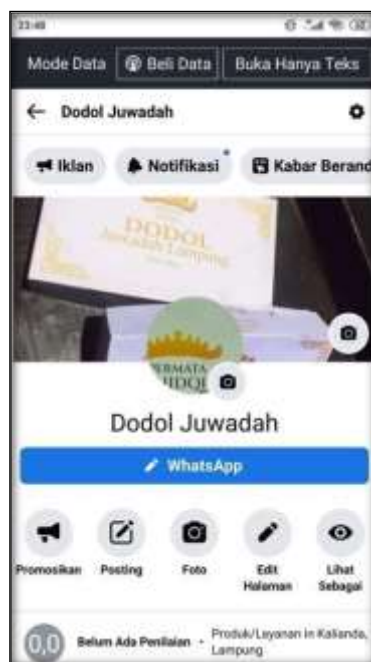
Gambar 5. Media Sosial halaman Facebook